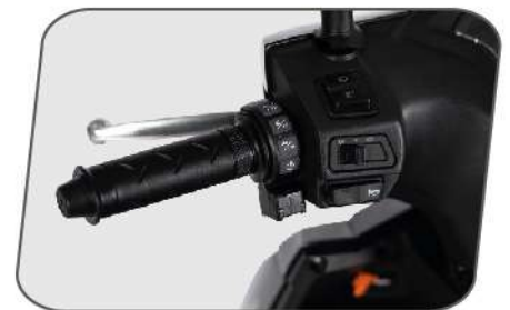
COMANDOS EN EL MANILLAR